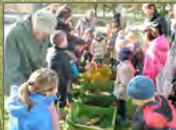
Nos écoliers découvrent les poissons