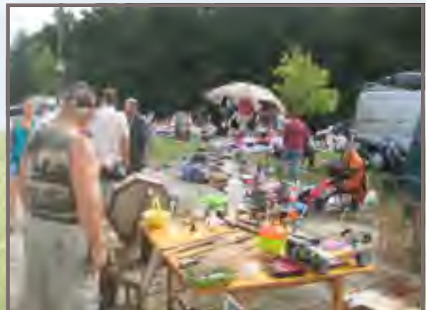
À la brocante, faites votre choix...