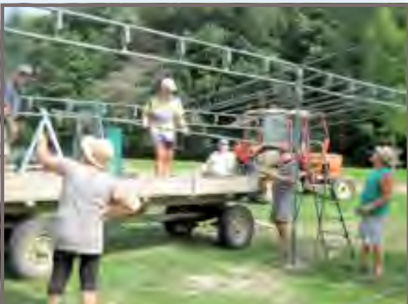
Montage du stand pour la brocante