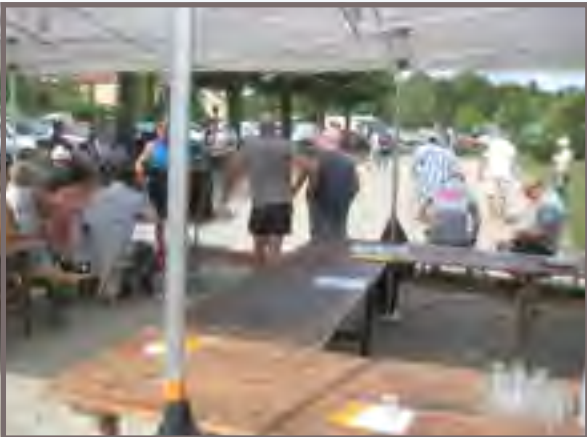
Pétanque par Yéto le Boibien