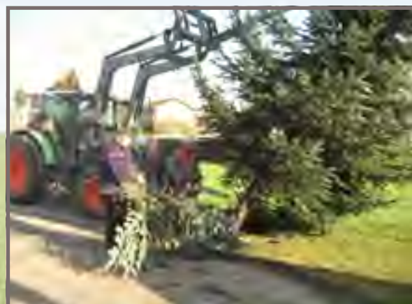
Nos employés dressent le sapin de Noël