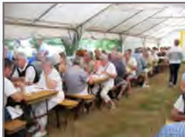
Le meilleur moment de la Kermesse