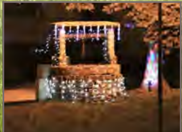
Bravo Dédé !