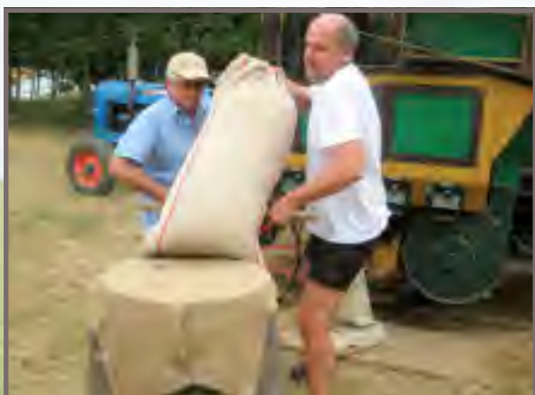
Encore un effort et c'est bon !