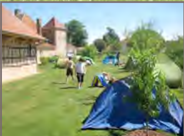
Centre aéré à La Malatière