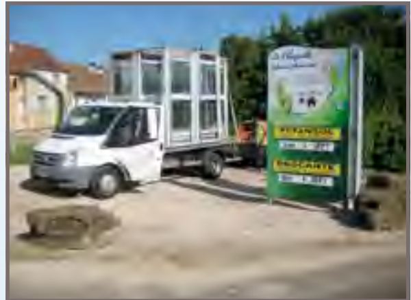
On ne reverra plus notre cabine téléphonique