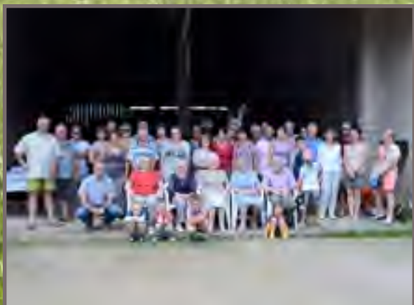
Fête des voisins à Chavenne