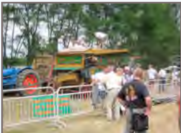
On ne se lasse pas de regarder la «Breloux»