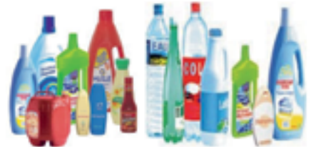
BOUTELLES ET FLACONS PLASTIQUES