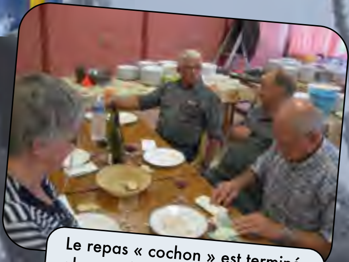
Le repas « cochon » est terminé, alors on fait les comptes avec de sérieux gardes du corps !