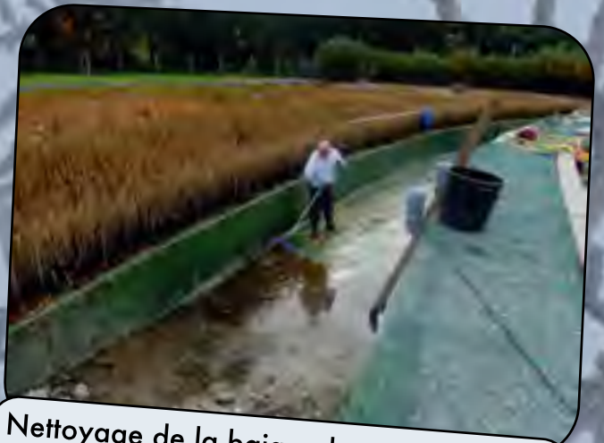
Nettoyage de la baignade par J. Jacques