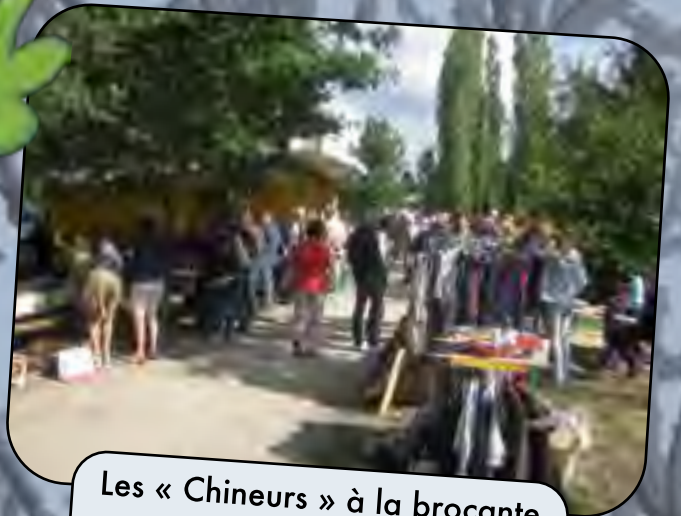
Les « Chineurs » à la brocante de septembre