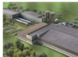
Usine de Méthanisation ECOCEA de Chagny

méthanisation génère fréquemment des perturbations.