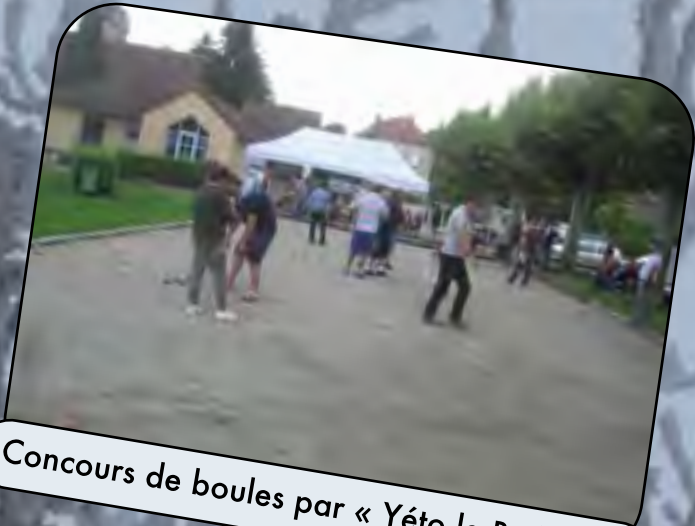
Concours de boules par « Yéto le Boibien »