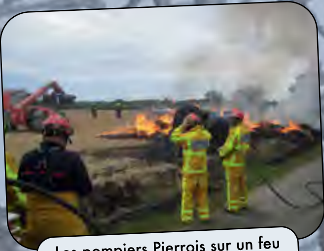
Les pompiers Pierrois sur un feu de paille à Masse