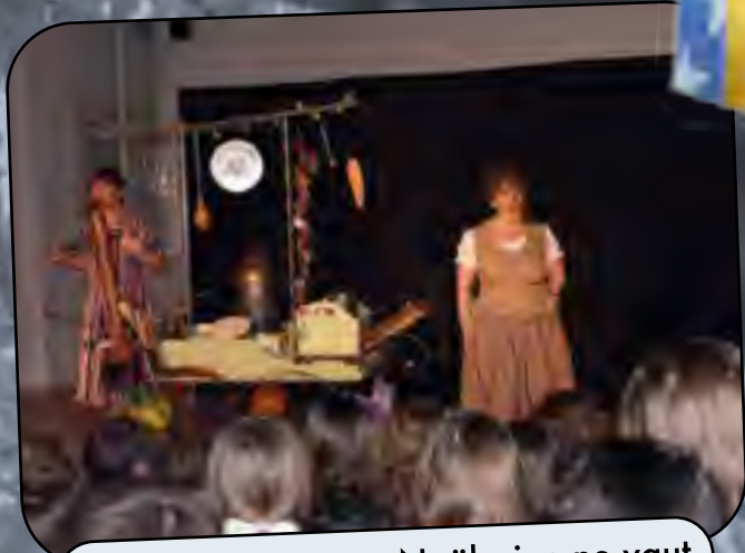
Pour bien préparer Noël, rien ne vaut un beau spectacle !