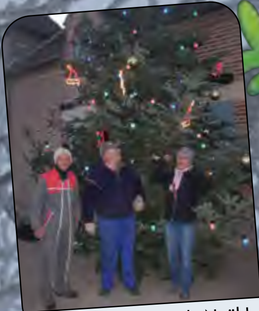
Il est joli notre sapin de Noël !