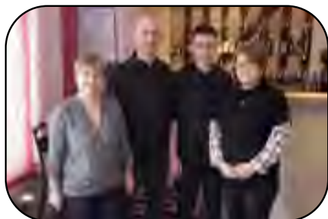
L'équipe qui vous accueille et la salle de restaurant.