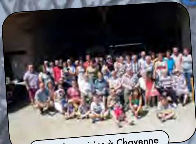
Fête des voisins à Chavenne