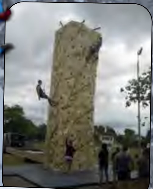
De futurs champions d'escalade