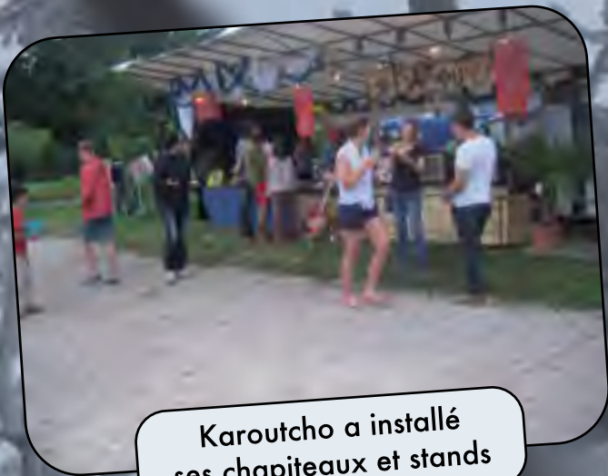
Karoutcho a installé ses chapiteaux et stands