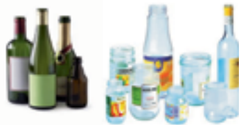
VERRE COULEUR—VERRE BLANC