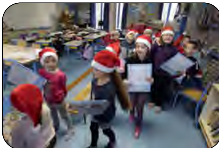
La distribution des calendriers de l'aveug.

Rendez-vous pour le prochain épisode sur le bulletin de l'été.